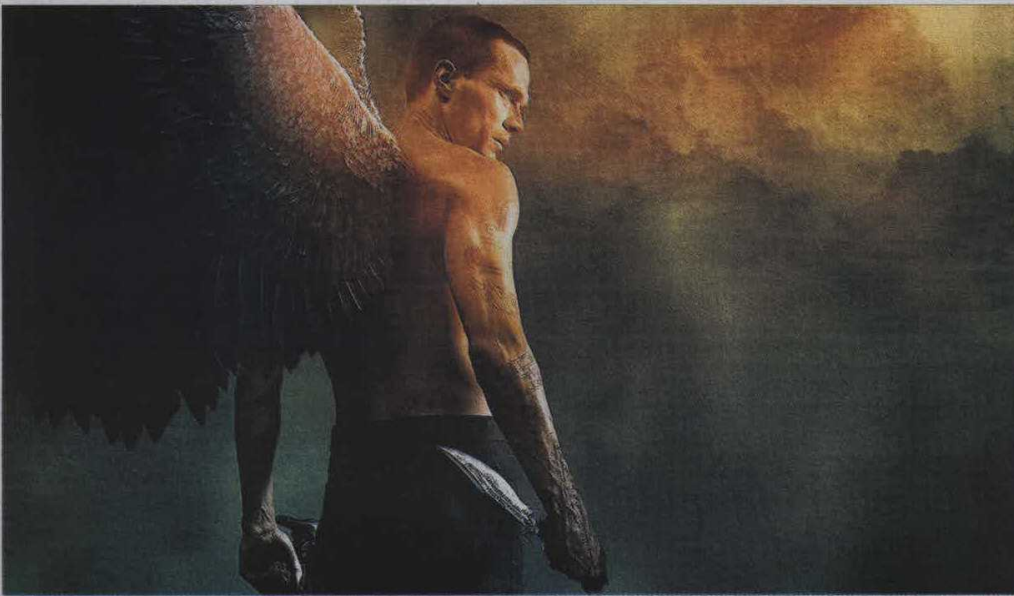
&gt;&gt; Uno de los ángeles caídos de la película 'Legión', de Scott Stewart y protagonizada por Paul Bettany y Dennis Quaid, que se estrenó el 28 de mayo.

|| La nueva novela de Stephenie Meyer entra en la lista de los más vendidos con un solo día en las librerías